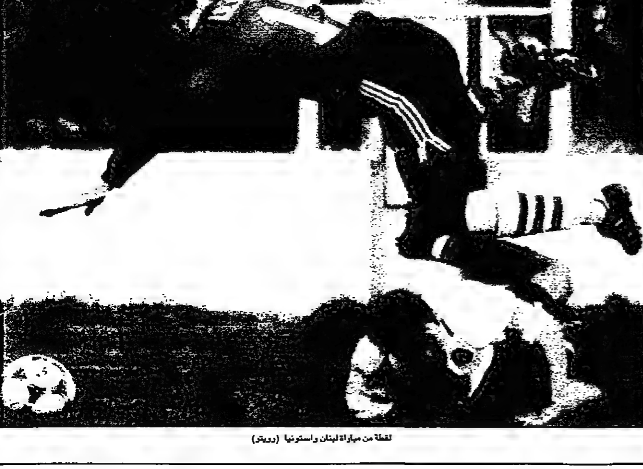
لعبت من مباراة لبنان واستونيا

سقطوا على ملعب بلبل الثلثي موسم حجاج وجمال طه وراثة ابو النصر، وصنع حجاج فرصة اولي للهجوم ترو الذي سددها بقوة وبعدها يوم براءة (66) قبل ان يسجل بلبل برأسه الهدف الاول بتمريرة من طه عبر وارطان وبعد يومين من زاهر العنباري سجل حجاج الكرة من ترو عبر وارطان وسددها في جانب القائم (40).